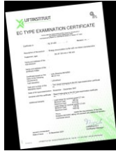
nieuwe Richtlijn liften 2014/33/EU — 24 juni 2014

Oude EG-typecertificaten en steekproefgoedkeuringen volgens huidige RL 95/16/EG blijven gewoon geldig onder de nieuwe RL 2014/33/EU.