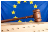
nieuwe Richtlijn liften 2014/33/EU --- 24 juni 2014